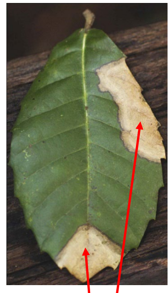
Manchas en hoja de tanoak que no son SOD