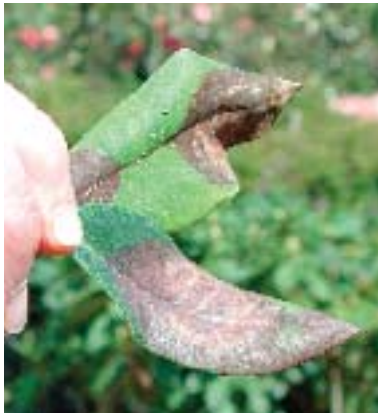
Foto 4 (derecha). Manchas en las hojas del Rhododendron.