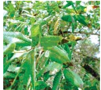
Foto 2. California bay laurel (también se llama pepperwood, o Oregon Myrtle) muestran manchas en las hojas típicas de Phytophthora ramorum .