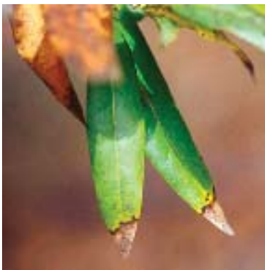
Foto 3 (izquierda). Manchas en las hojas del Bay laurel.