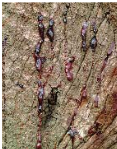
Foto 6 (derecha). Un tronco sangrando del tankoak.